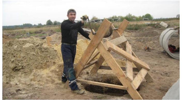
Скоро будет вода