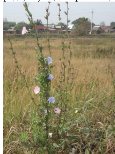
Маленькое чудо на месте разрушенного Храма