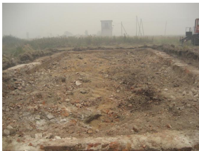
После ручных работ на место раскопок старого фундамента пришла техника