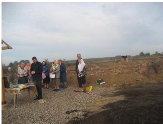
Успение Пресвятыя Богородицы