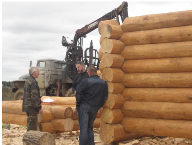
Ярославская область. Здесь готовился сруб зимней церкви.