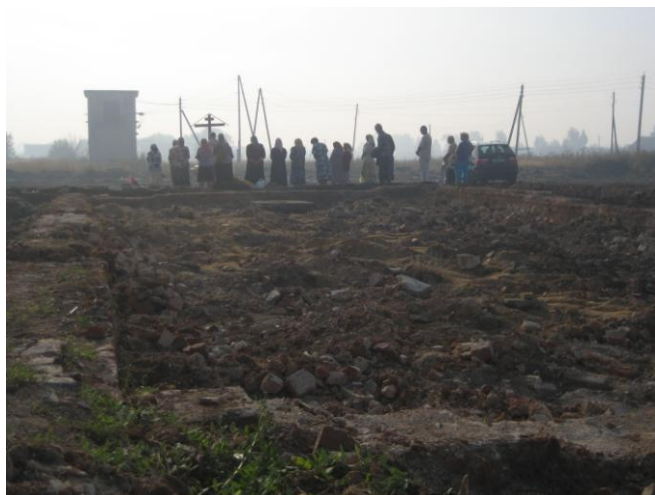
Происхождение Честного и Животворящаго Креста Господня