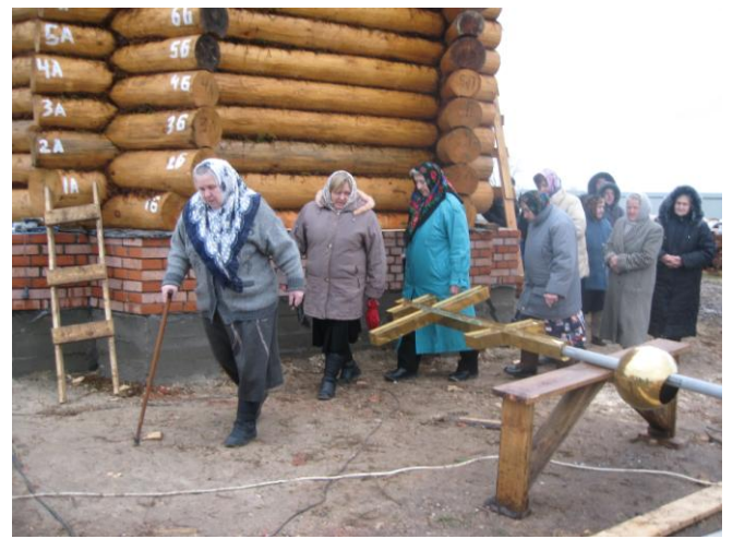
Установление креста и купола